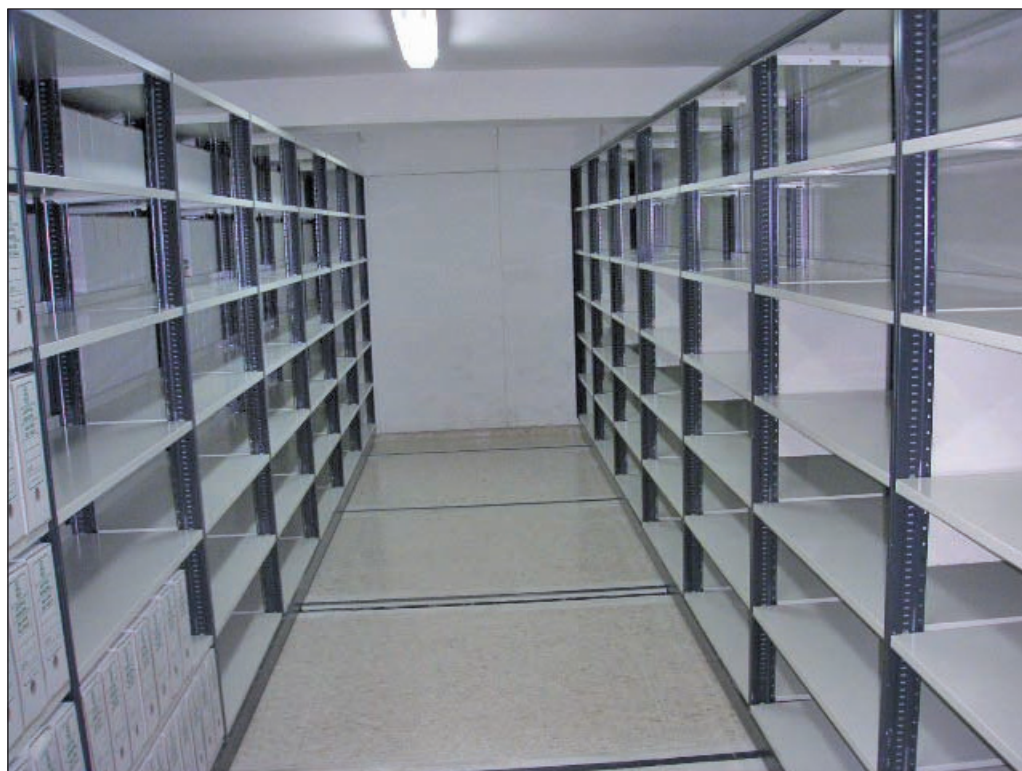
Archivo Municipal despues de su organización. Septiembre 2007.