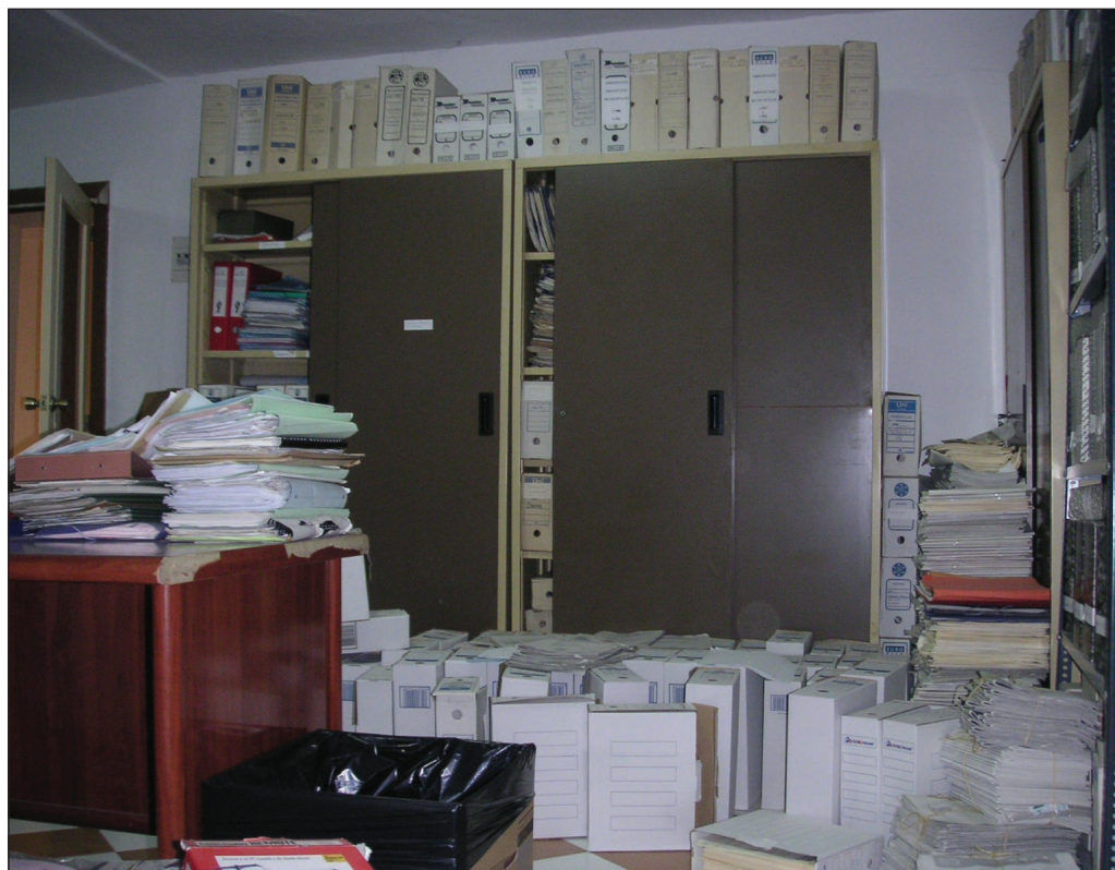
Archivo Municipal antes de su organización. Septiembre 2005.