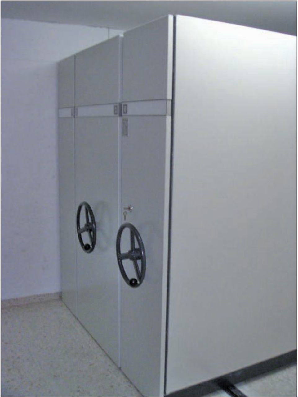
Archivo Municipal despues de su organización. Septiembre 2007.