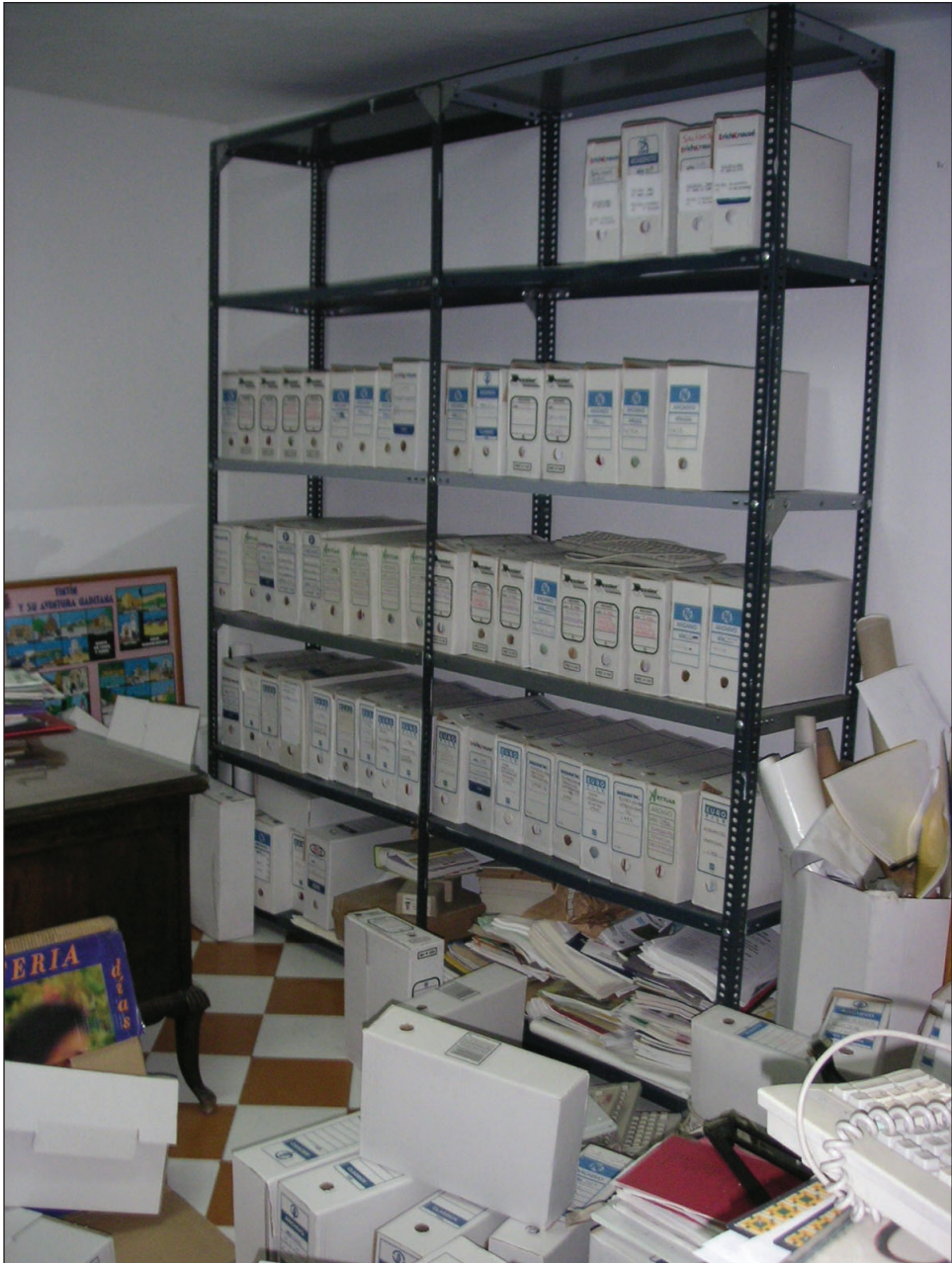
Archivo Municipal antes de su organización. Septiembre 2005.