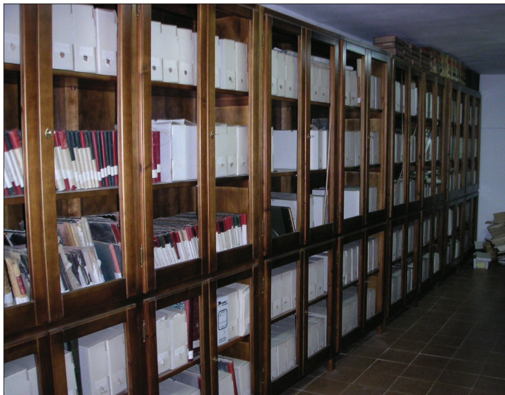
Archivo Municipal antes de su organización. Septiembre 2005.