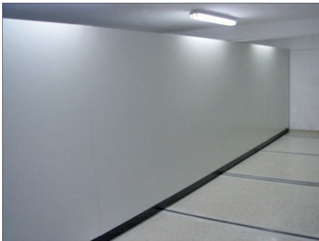
Archivo Municipal despues de su organización. Septiembre 2007.