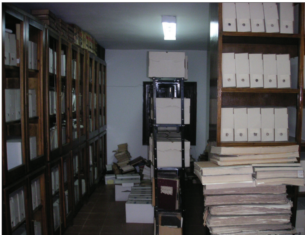
Archivo Municipal antes de su organización. Septiembre 2005.