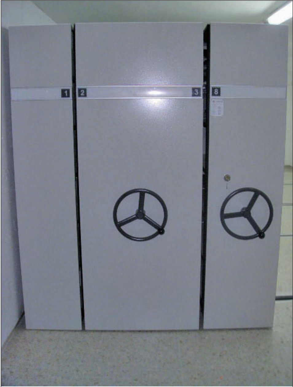
Archivo Municipal despues de su organización. Septiembre 2007.