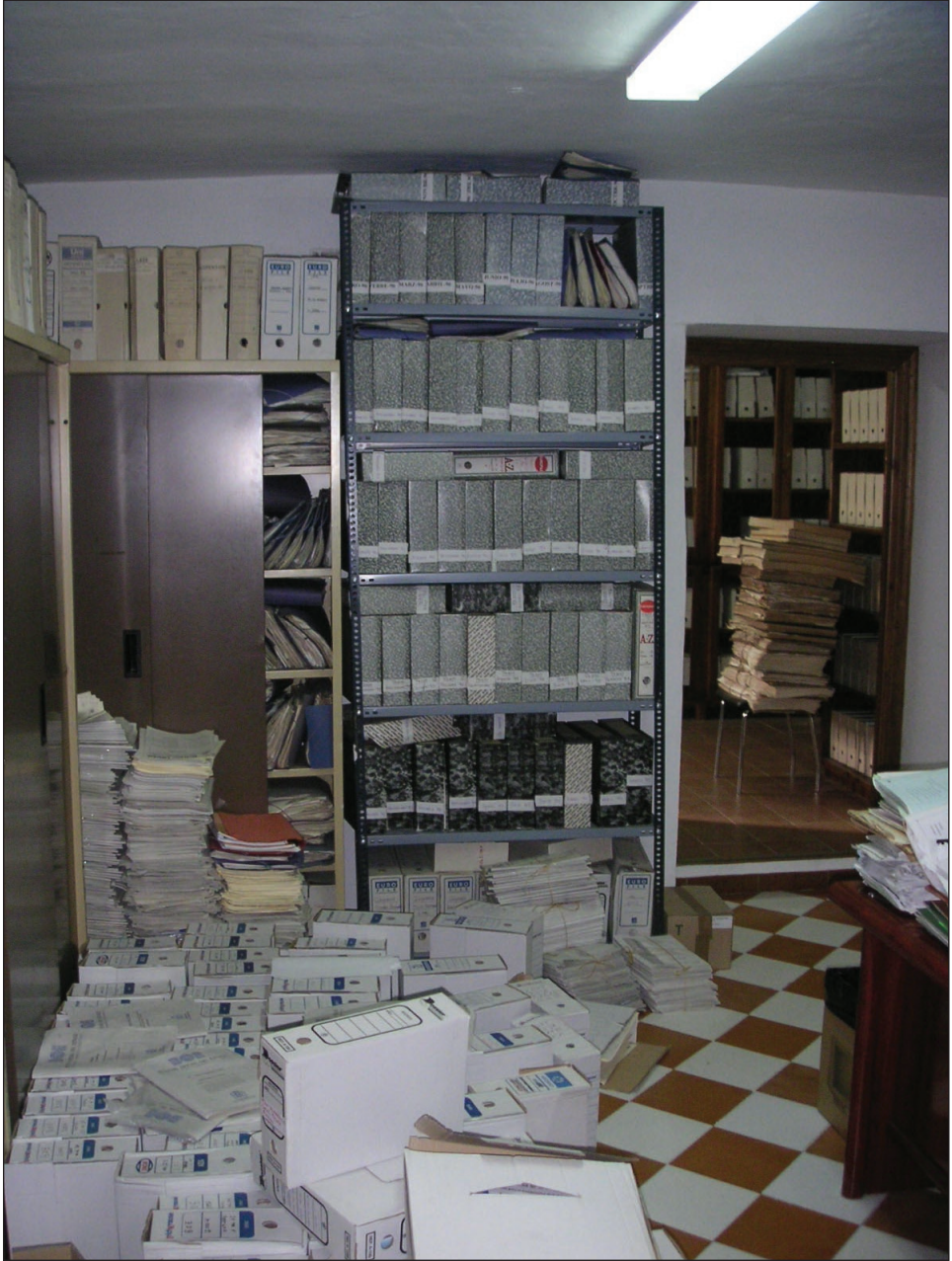
Archivo Municipal antes de su organización. Septiembre 2005.